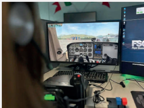
SIMULATORE DI VOLO E DEL CONTROLLO DEL TRAFFICO AEREO