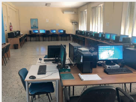
LABORATORIO DI INFORMATICA E DI LINGUE